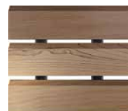
Western Red Cedar